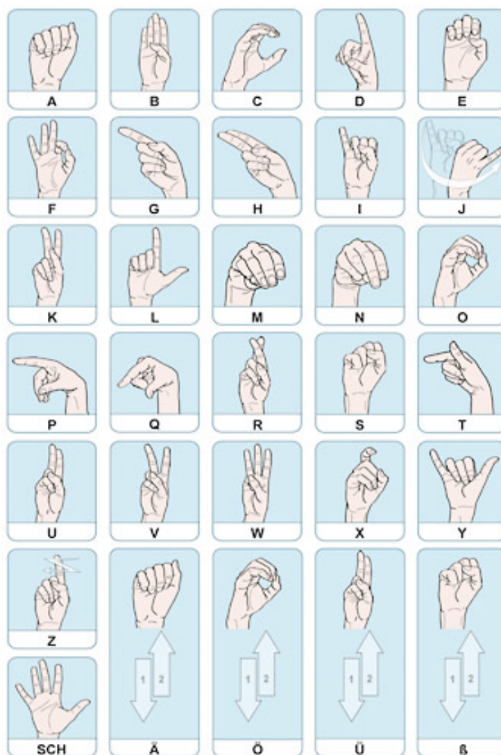
Abbildung: Internationales Fingeralphabet plus die deutschen Umlaute.

Nicht nur in Wortschatz und Syntax sondern auch bezüglich Zahlen gibt es weltweit eine riesige Bandbreite an Systemen. So wird z. B. in Österreich von 1 bis 10 mit zwei Händen gezählt, in American Sign Language aber nur mit einer Hand.